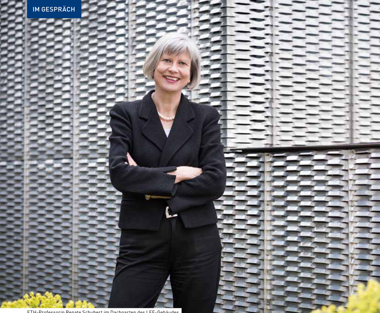
ETH-Professorin Renate Schubert im Dachgarten des LEE-Gebäudes.