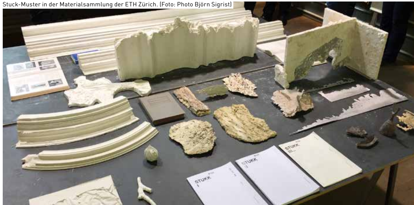
Stuck-Muster in der Materialsammlung der ETH Zürich.