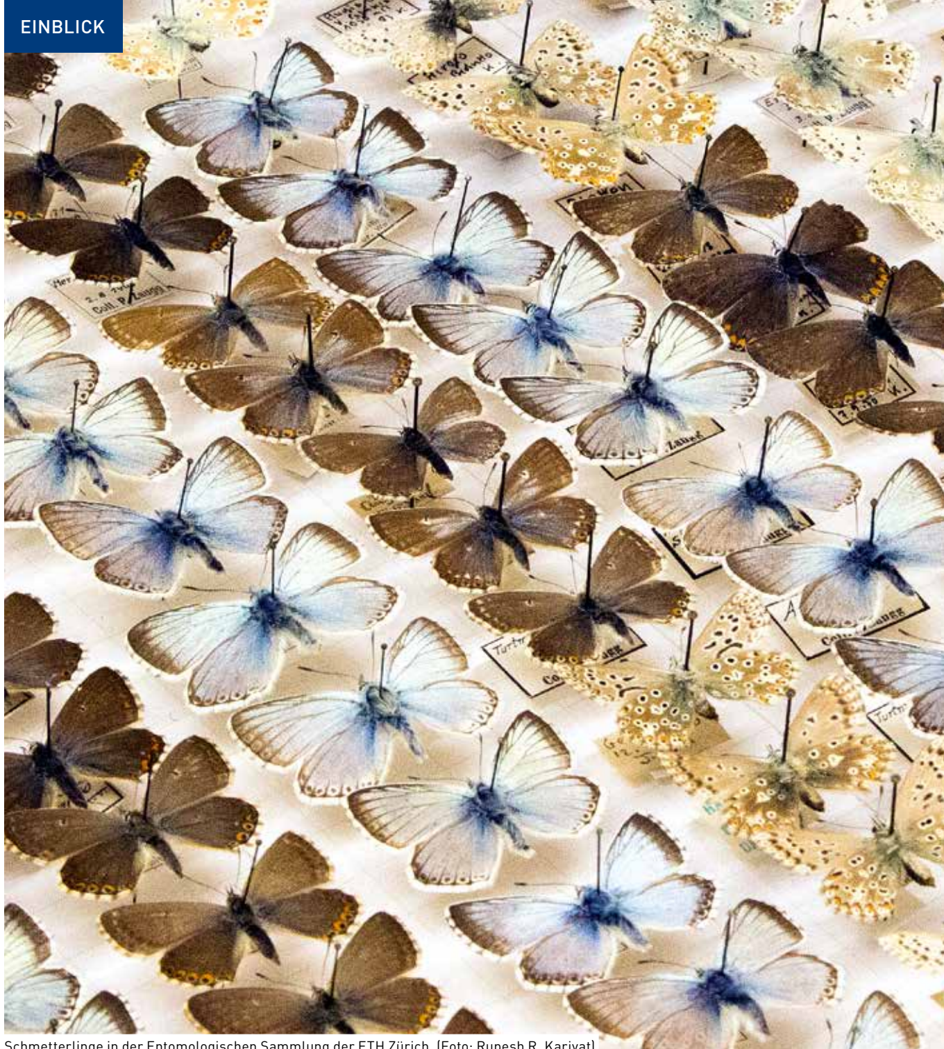
Schmetterlinge in der Entomologischen Sammlung der ETH Zürich.